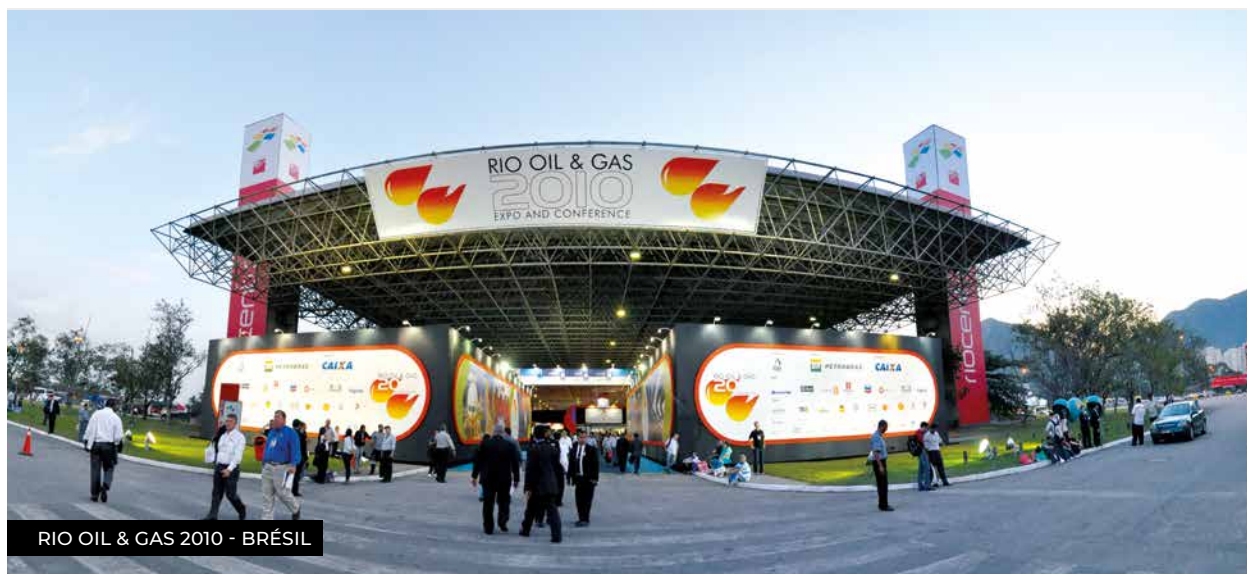
RIO OIL & GAS 2010 - BRÉSIL

L'EXPORTATION DU CONCEPT D'ÉVÉNEMENTS PROPRIÉTAIRES sur différentes zones géographiques se confirme comme une forte valeur ajoutée pour le Groupe (Première Vision à New York, São Paulo et Moscou, Bocuse d'Or à New York, Sirha à Shanghai et Genève...).