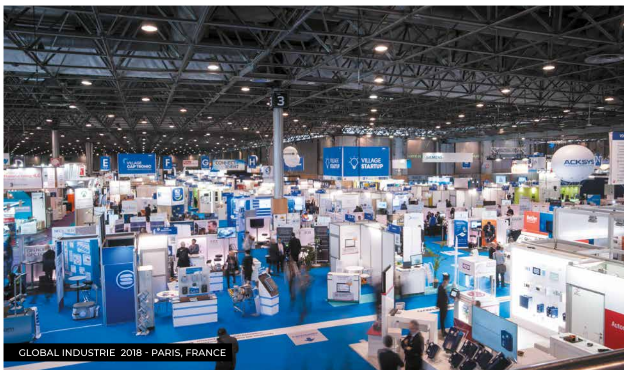
GLOBAL INDUSTRIE 2018 - PARIS, FRANCE

Pour la première fois, GL events a participé au China International Import Expo, qui a accueilli plus de 3 800 exposants et 500 000 visiteurs professionnels nationaux et étrangers. GL events a généré de nombreux leads, allant du développement et de l'exploitation de sites événementiels au lancement de nouvelles manifestations en Chine, en passant par la fourniture de services pour les grands événements internationaux.