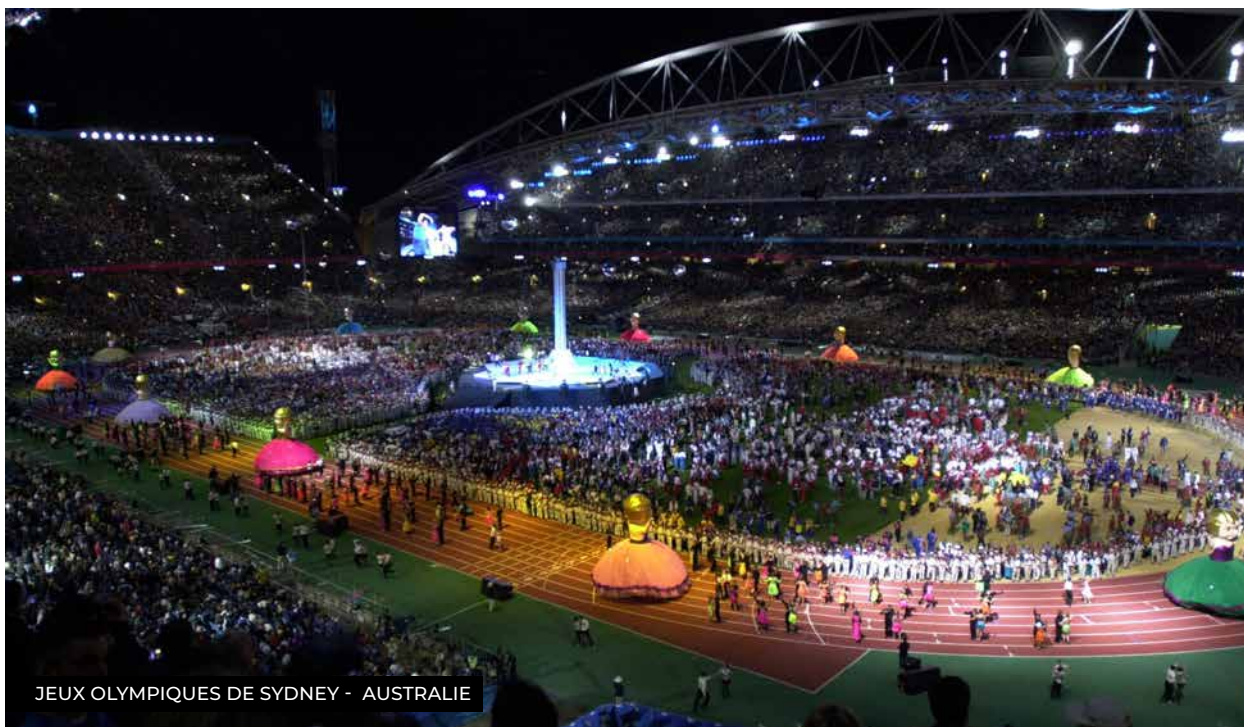
JEUX OLYMPIQUES DE SYDNEY - AUSTRALIE