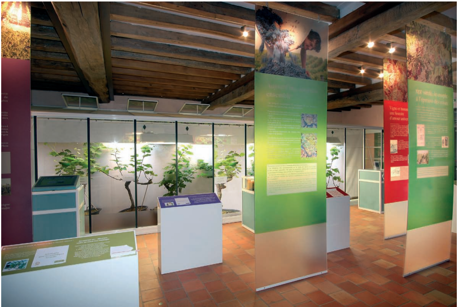
Agencement muséographique Musée du Vin et de la Vigne – Angers / Interior fit-outs museography Wine and Vine Museum – Angers

Our solutions are adapted to the desired atmosphere, through the construction of bespoke designs on which we work closely with designers, museographers, architects and scenographers.