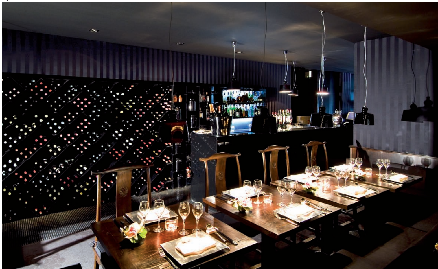
Agencement restaurant TSE YANG - Paris / Architecte : ACHILLE / Interior fit-outs TSE YANG restaurant - Paris / Architect: ACHILLE

As such, GL events can offer the same level of quality on temporary projects such as exhibition venues and in permanent layouts such as shops, hotels and showrooms.