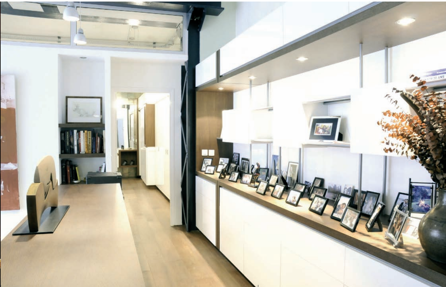
Aménagement intérieur loft - Paris / Interior fitting loft - Paris