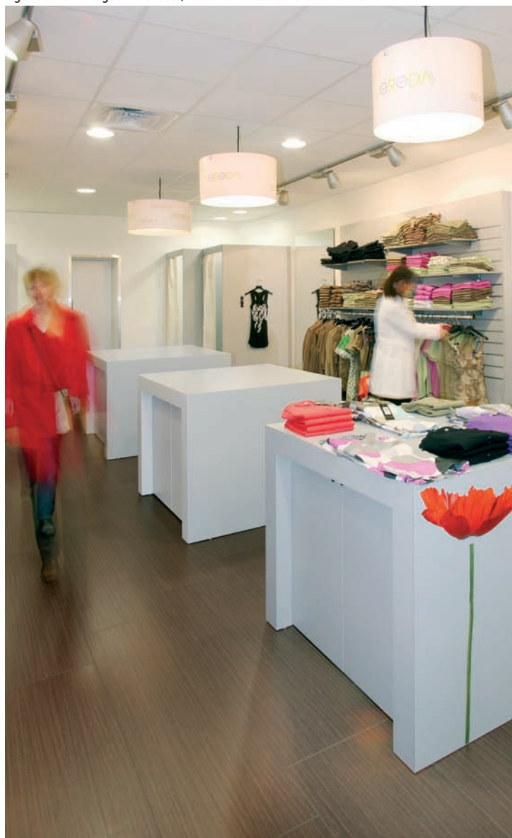
Agencement magasin Vereda / Interior fit-outs Vereda store